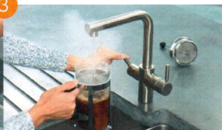
Op til 98° C - perfekt temperatur til varme drikke