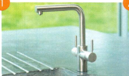
Moderne italiensk design